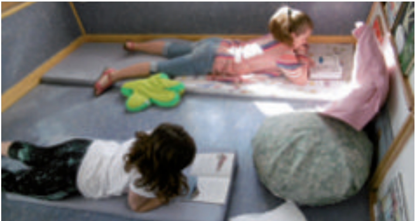
Irakurzaletasuna bultzatzea da eskola txikiotan helburuetako bat.