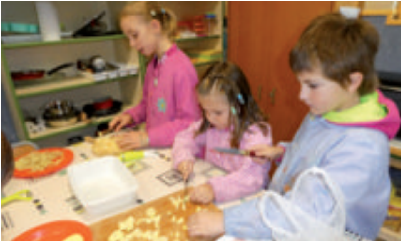
Bene-benetan egiten dute lan Zizurkilgo San Millan eta Abaltzisketako Txalburu eskoletako ikasleek.

Edozein kasutan, Zizurkilan eta Abaltzisketan argi dute umeak ez direla heldu txiki batzuk, eta Jean Piagetek esan bezala, helduekin alderatuz gero, garun estruktura ezber-dinak dauzkatela; eta, ondorioz, ez dutela mundua helduek