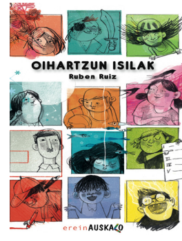
OIHARTZUN ISILAK Ruben Ruiz / Maite Mutuberria

Zeruan hegan dabiltzan enarei begiradaude Xuban eta bere aita... “Lurraren bestaldeko muturrera doaz”, azaldu dio aitak. “Handitzen naizenean horren urrun joan ahal izango naiz ni ere”, galdetu dio Xubanek. “Bizitzaren bidaia” haurrengan pizten dituen beldurrei aurre egiten laguntzeko kontakizun poetikoa da liburu hau.