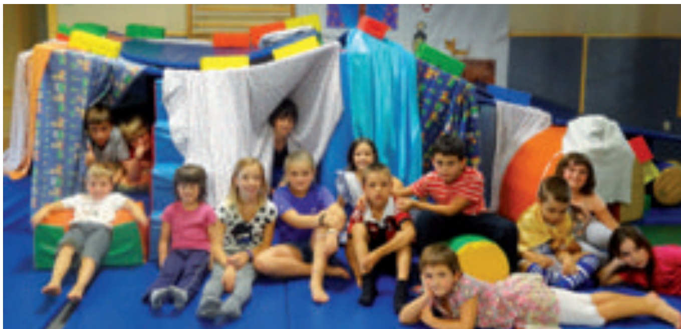
Zaharrenek ere aukera paregabeak dituzte.