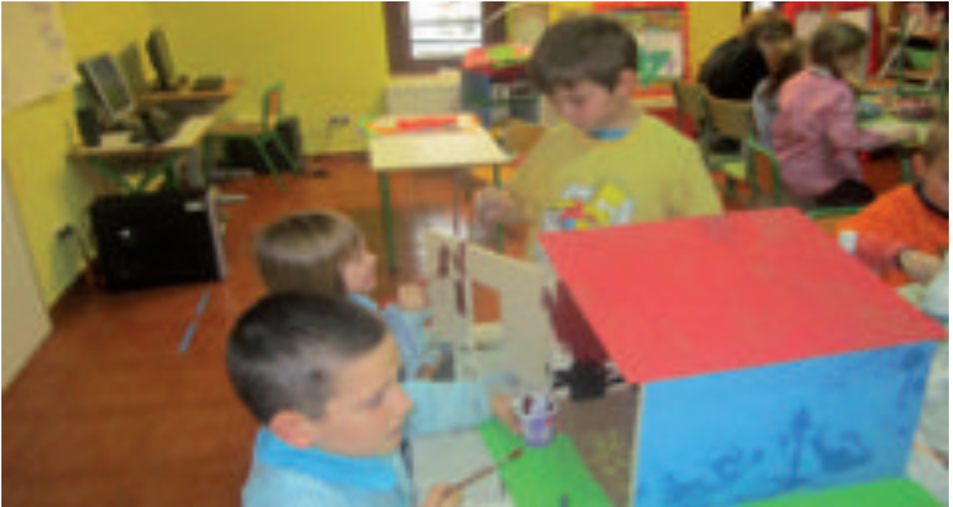
Dena dena umeek egiten dute.

funtsezkoa iruditzen baitzaie prozesu horretan irakasleak ere irakurzale eta idazle sentitzea haurrekin batera; hau da, haiekin batera irakurtzea eta haiekin batera idaztea, eta, zailtasunak ere haiekin batera bizitzea eta elkarrekin aurre egitea.