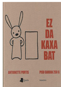
EZ DA KAXA BAT Antoinette Portis

Liburuxka hau Banaezinak izeneko bildumaren lehen zenbakia da. Banaezinak Jon, Julene, Lukas, Lea, Peru eta Aminatak osatutako lagun kuadrila da. Aurten Julene bakar-bakarrik dago ikasgelan. Beste talde batean tokatu zaio. Berak ongi prestatuak zeukan dena: zorroa, arropa, kutxatila... baina hori ez zuen espero. Lortuko al du bizirautea Banaezinetatik aparte?