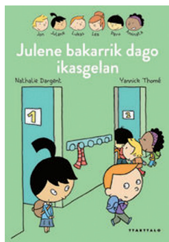
JULENE BAKARRIK DAGO IKASGELAN Nathalie Dargent / Yannick Thome

Ottoline bildumaren laugarren titulua da. Oraingoan, Ottolinek pertsonaia burutsua eta trebatua ezagutu du, Azeri Morea, eta berari eta Mr. Munroeri zin egiten die gauz hiri safari bat egingo dutela. Bere lagun berriarentzako sari gisa, Ottolinek bere etxean egingo duen jai batera gonbidatzen du; bertan, lagunduko dio ohartzen bere idazkari adeitsua bere bizitzako maitasuna dela.